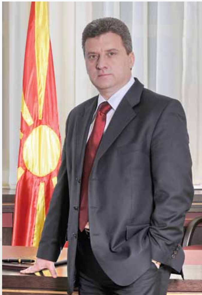
Dr. Gjorgje IVANOV , President i Republikës së Maqedonisë, komandant suprem i forcave të armatosura të RM

Me këtë rast dua t'ju shpreh mirënjohje publike dhe respekt të gjithë paqeruajtësve të Armatës së Republikës së Maqedonisë të cilët në periudhën e deritashme kanë investuar shumë mund dhe përkushtim në angazhimin në misionet në Afganistan, Irak, Bosnjë e Hercegovinë dhe në Liban. Ata kanë kontribuar për vendosjen e paqes në vendet në të cilat kanë qenë të angazhuar, njëkohësisht duke afirmuar atdheun tonë në planin ndërkombëtar. Besoj se në të ardhmen e afërme, Republika e Maqedonisë edhe formalisht do të bëhet pjesë vëllazërisë euroatlantike të popujve e cila është e përkushtuar në vendosjen e sigurisë më të madhe, demokracisë dhe të drejtat njerëzore gjithkund nëpër botë.