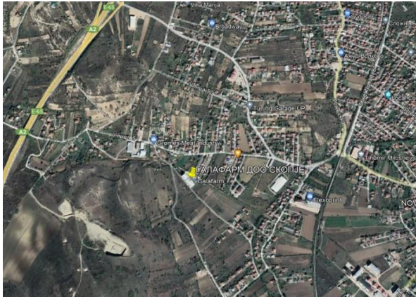
Слика 1: Макролокација на инсталацијата

„Друштвото за производство на лекови, гранични и козметички производи Галафарм ДОО Скопје Закон За Животна средина