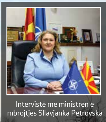
Intervistë me ministren e mbrojtjes Sllavjanka Petrovska

ARMATA E REPUBLIKËS SË MAQEDONISË SË VERIUT