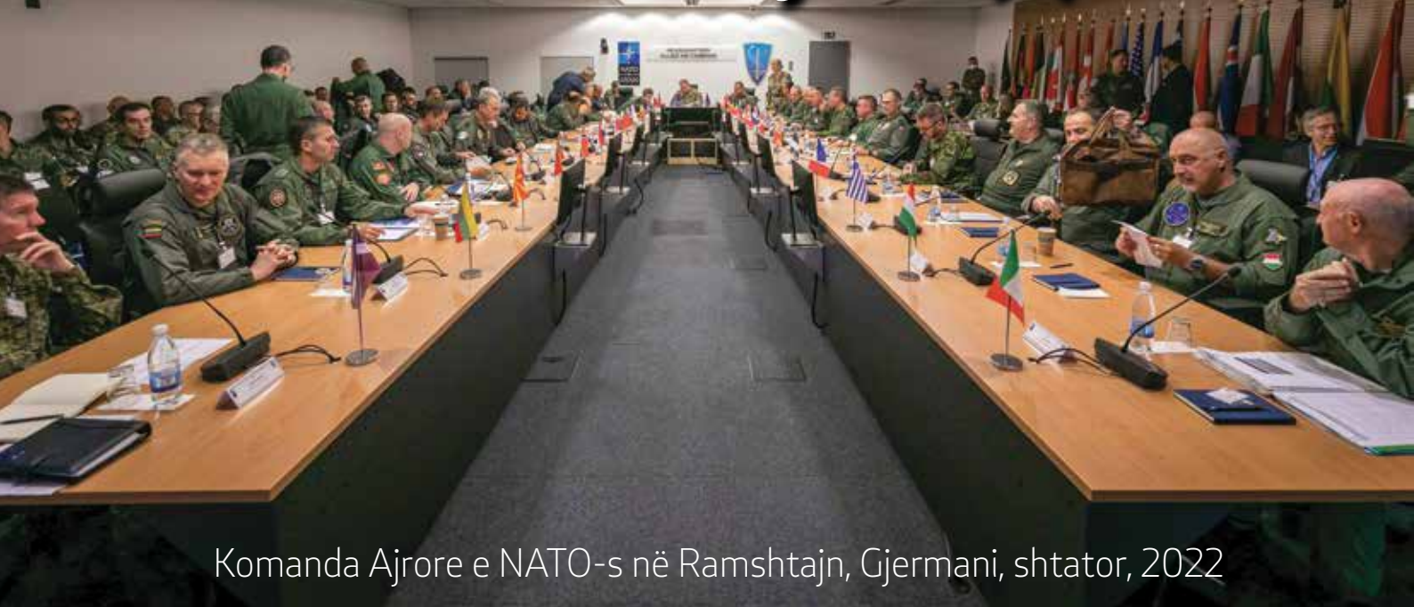
Komanda Ajrore e NATO-s në Ramshtajn, Gjermani, shtator, 2022

N ga Forcat Ajrore të Shteteve të Bashkuara dhe gjenerali Charles Quinton Brown Jr. u organizua dhe u mbajt një Konferencë Ndërkombëtare e Forcave Ajrore me pjesëmarrjen e 49 komandantëve të Forcave Ajrore. Ngjarja u mbajt në Uashington me rastin e 75 vjetorit të krijimit dhe zhvillimit të Forcave Ajrore të SHBA-së, sukcesi i së cilës bazohet në marrëdhënie të thella dhe të qëndrueshme me aleatët dhe partnerët. Forcat Ajrore të Shteteve të Bashkuara u krijuan si një degë e veçantë e forcave të armatosura në vitin 1947 me miratimin e Aktit të Sigurisë Kombëtare. Ajo lidhje e aviacionit ushtarak ka ecur gjithnjë e më shumë në një partneritet të rëndësishëm strategjik, në radhë të parë përmes prizmit të forcimit të marrëdhënieve me aleatët dhe partnerët, përmes një bisede domethënëse për disa tema globale dhe strategjike, si dhe përmes shkëmbimit të informacionit. Në botën e sotme më të ndërlikuar, komplekse dhe të pasigurt, forcat ajrore të gjitha kombeve të përfaqësuara në Konferencë ranë dakord se ata duhet të punojnë së bashku në mënyrë që të përparojnë dhe të arrijnë sukses.