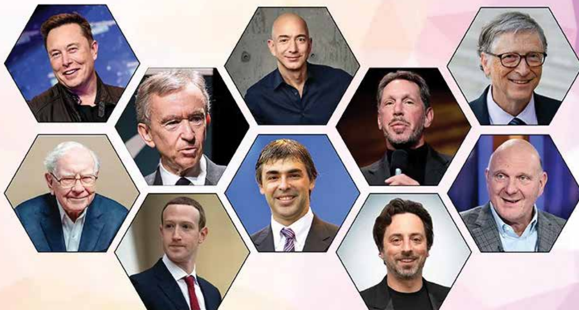
10 RICHEST PERSON IN THE WORLD 2023