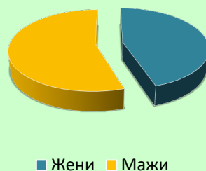
Zyrtarët administrativë në MM

Të dhëna të ndara sipas gjinisë për personelin ushtarak në Ministri dhe Armatë në vitin 2023: