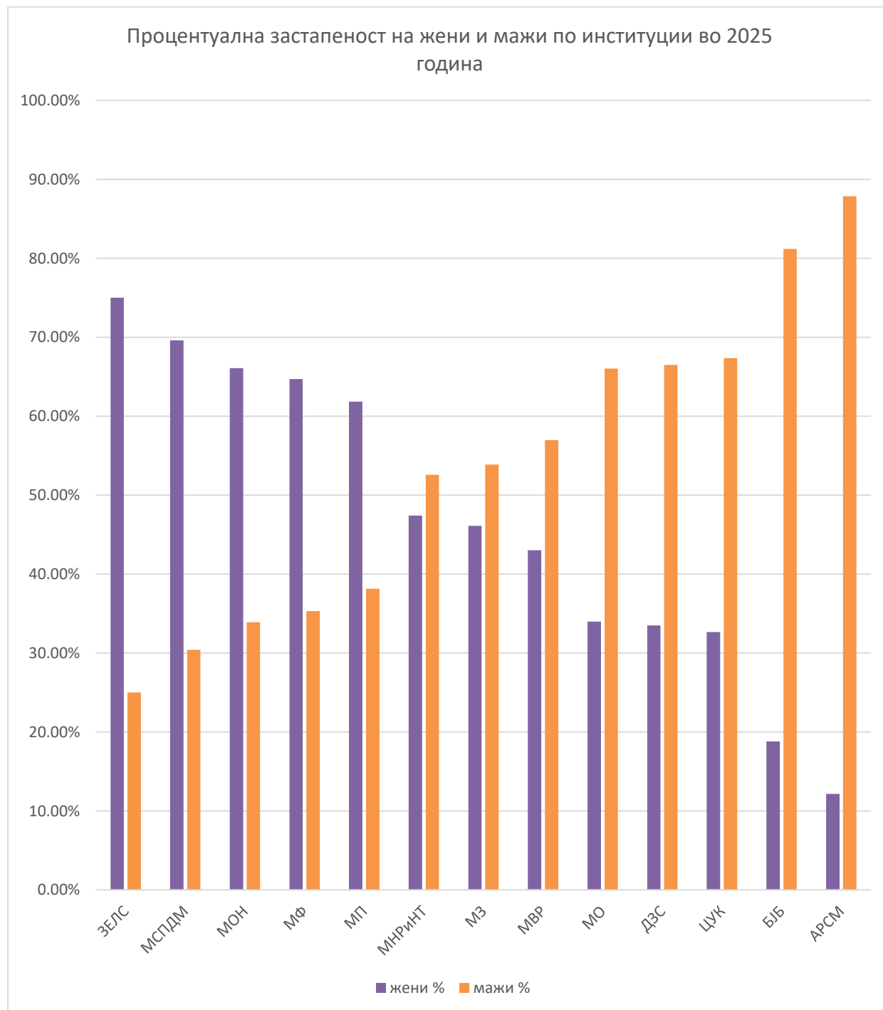
Прилог бр.1: Приказ на процентуална застапеност на жени и мажи по институции 3 во 2025 година