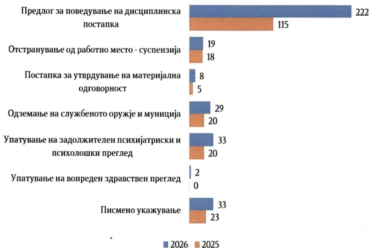
Графикон 1. Поднесени предлози и изречени задолжителни мерки

При постапувањето на Одделот, утврдени се одредени неправилности, за кои Одделот даде препораки / укажувања на 35 организациски единици во Министерството, согласно член 20 од Правилникот за начинот на вршење на работите во Одделот за внатрешна контрола, криминалистички истраги и професионални стандарди на Министерството на внатрешни работи, а со цел отстранување на неправилностите и подобрување на работењето.